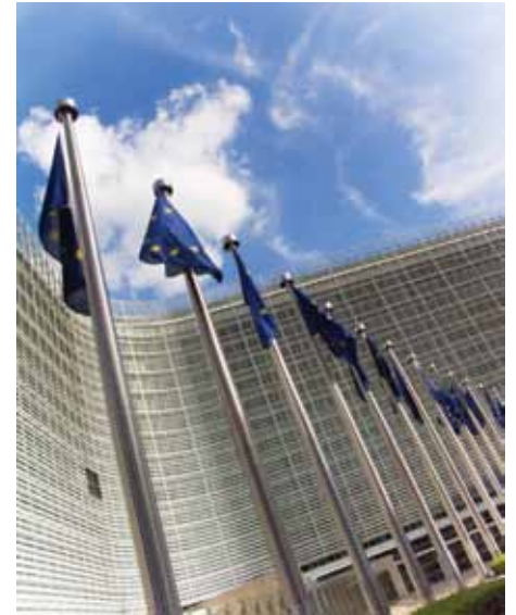
Europa wordt verweten teliberaal te zijn.

Welk beleid wordt hier in feite bekritiseerd? Brussel staat erom bekend een Mekka te zijn van lobbywerk. Als thuisbasis van 15.000 lobbyisten en 2600 permanent in Brussel gevestigde belangengroeperingen wordt er vergaderd, beïnvloed, handjes geschud en gegoocheld met statistiek en data bij de vleet. Het is een niet onbekend probleem voor liberalen: privébedrijven en private belangen proberen altijd hun invloed te hanteren om overheden ertoe te brengen beslissingen te nemen of privileges te verlenen in hun voordeel, liefst overgoten met een smakelijk sausje van 'algemeen belang'. En hoe groter het bedrijf, hoe groter hun vloot lobbyisten. 'Als u wat protectionisme toestaat in onze sector, dan zal dit ten goede komen aan alle Europese burgers' of 'Als u overheidssteun in deze bedrijven toestaat, zal dit de economie een nieuwe boost geven en welvaart creëren'. Ik hoef niet uit te leggen aan de doorwinterde liberaal dat deze