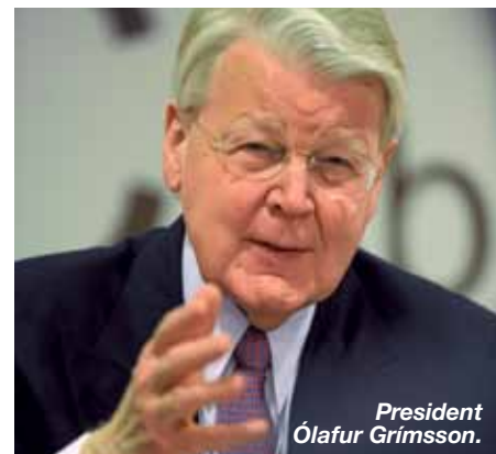
President Ólafur Grímsson.

De soep zal wellicht niet zo heet gegeten worden. Premier Sigurdarsdóttir kondigde meteen aan dat IJsland vanaf deze zomer al start met terugbetalingen. Ze maakt zich