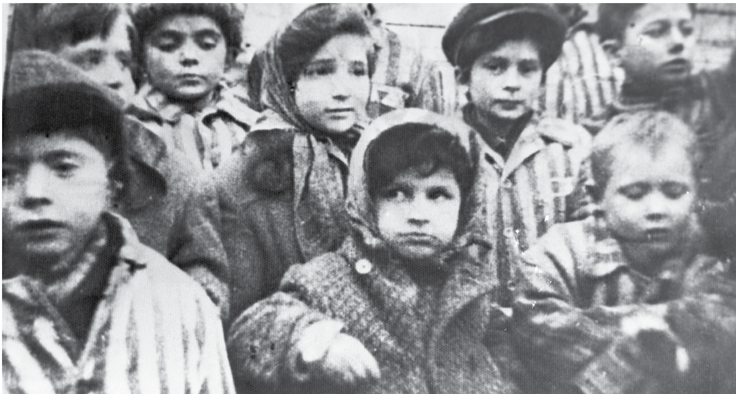
Kinderen na de bevrijding van het concentratiekamp van Auschwitz.

Jaargang 132 - nummer 4 - mei 2011 - maandblad